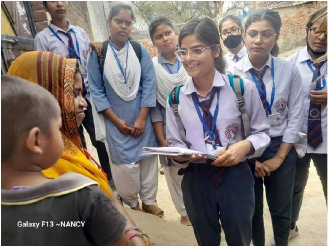
Galaxy F13 ~NANCY